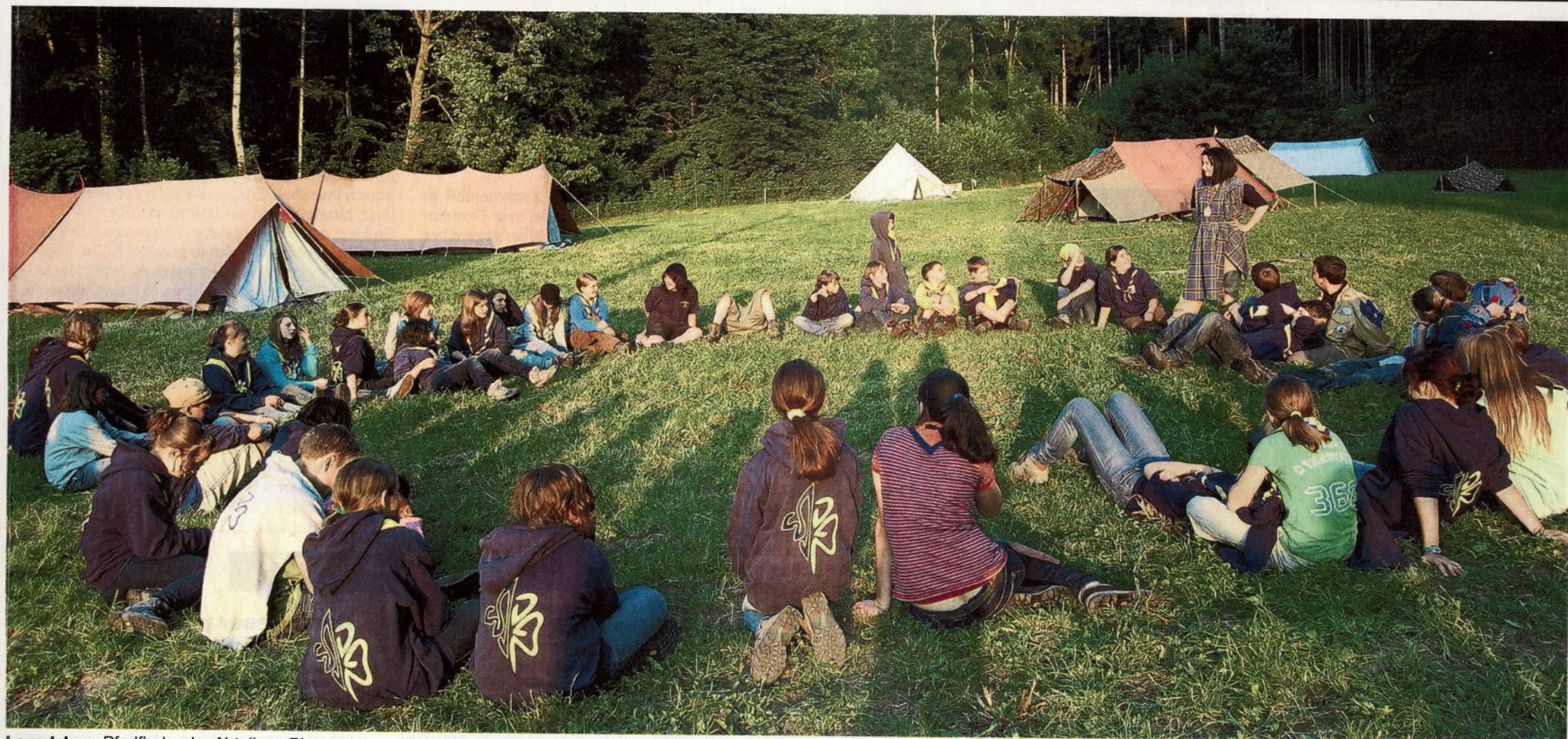
Lagerleben. Pfadfinder der Abteilung Blauenstein auf ihrem Lagerplatz in Stein am Rhein im Kanton Schaffhausen.