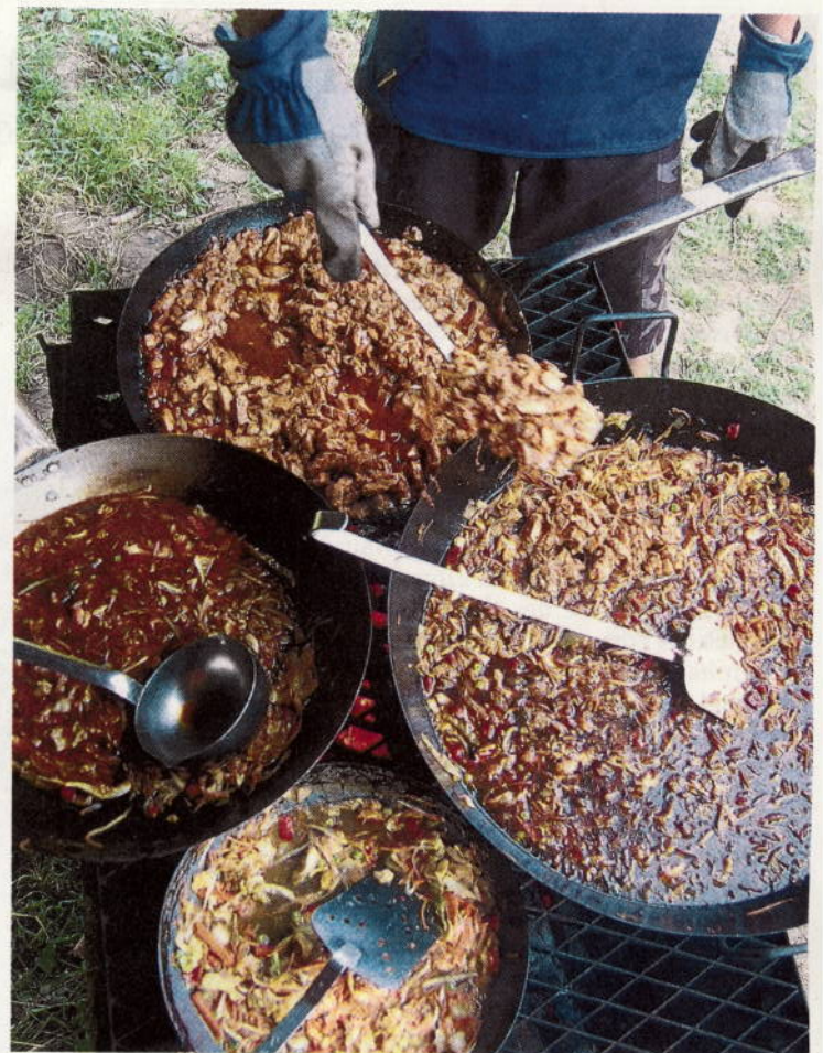
Hungrig. Essensausgabe bei der Pfadi Blauenstein.

VERFEINDETE CLANS. Über 50 Mitglieder der Pfadi Blauenstein reisten in ein fiktives, südamerikanisches Land in Stein am Rhein, dessen Diktator zur Vernunft gebracht werden musste. Ans andere Ende der Welt begab sich die Pfadi St. Urs. In Russland, gelegen im Kanton Glarus, musste sie verfeindete Clans im Kampf gegen den bösen Zaren vereinen. Die Jungschärler Binningen blieb in Prattigau auch vom Thema her in der Schweiz. Die Kinder begegneten vielen Schweizer Persönlichkeiten. Mithilfe von Heidi wurden zum Beispiel Ziegen gemolken und Butter hergestellt. Die Kinder werden nach ihrer Rückkehr aus den «fernen Ländern» nicht nur viele Erinnerungen im Gepäck, sondern auch einiges gelernt haben.